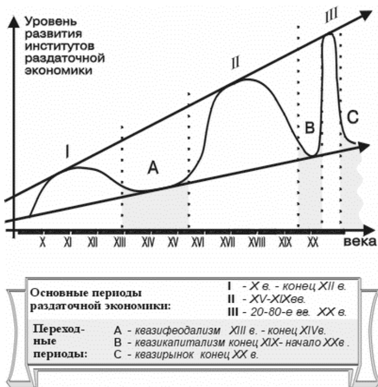
Рис.1. Институциональные циклы в развитии раздаточной экономики России

ределяет социальную, экономическую и научно-техническую политику общества.