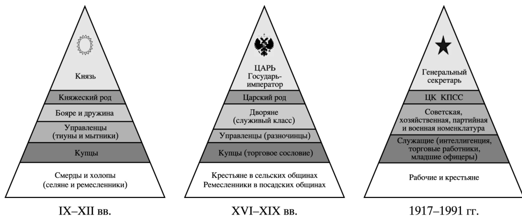
Рис. 2. Эволюция социально-служебной структуры в России.

империй Запада. Государства Востока раздавали завоеванные соседние территории в служебную собственность и включали их в состав своего государства. Государства Запада формировали колонии вдали от своих территорий и закрепляли захваченные земли в частную, то есть полную суверенную собственность [Хикс, 2003].