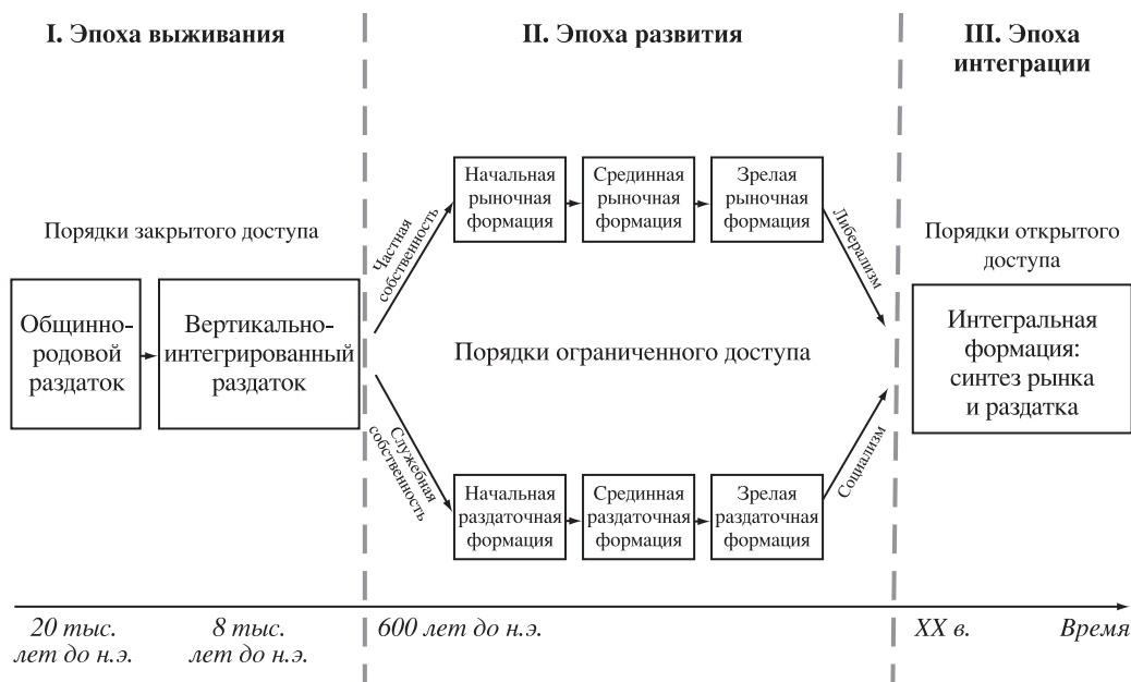
Рис. 3. Институциональные порядки и рыночно-раздаточная эволюция.

Примечание. Категории – порядок ограниченного доступа и порядок открытого доступа – введены Д. Нормом, Д. Уоллисом и Б. Вайнгатом. Здесь они используются для демонстрации соотношения между этапами рыночно-раздаточной эволюции и этими социальными порядками, которые в теории раздаточной экономики ранее я называла монасударством и демосударством (см. [Бессонова, 2007]).