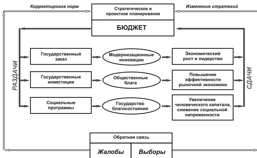
Рис. 1. Механизм социального государства на основе контрактного раздатка

Теория экономикс долго базировалась на абсолютизации рынка и частной собственности. Более того, утверждалось, что по сути нерыночные, архаичные институты должны быть преобразованы в рыночные. Однако в 2009 г. П. Самуэльсон внес существенные поправки в свой учебник по рыночной экономике, напи-