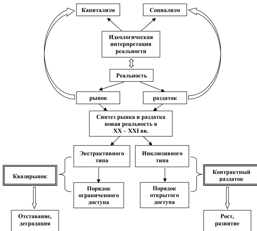
Рис. 2. Новая реальность как рамка развития в XXI в.

ных инвестиций в пользу конкурирующих узких кланов, искажая контур социального государства (Пикетти, 2015).