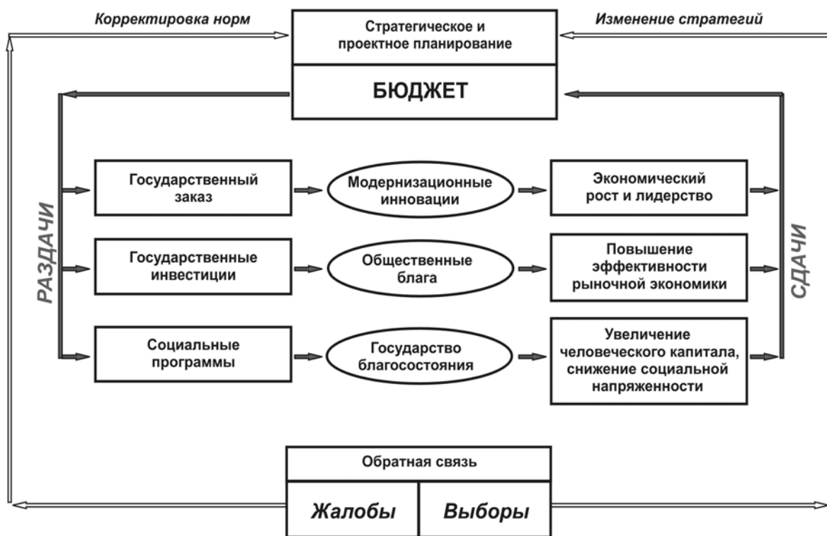
Рис. 2. Развитие социального государства на основе контрактного раздатка (составлено автором)

Все перечисленные исследования расширяют фундаментальную основу интегрально-институциональной парадигмы и в совокупности подводят к выводу, что развитие современного социального государства происходит на основе контрактного раздатка (рис. 2).