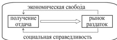
Рис. 2. Концептуальная рамка новой парадигмы

В рынке «получение» превалирует над «отдачей», личная мотивация прибыли обеспечивает реализацию общественных потребностей. В раздатке – мотивация служения обеспечивает доминирование отношений «отдач» над «получениями». Оба типа экономик всегда сосуществовали, дополняли друг друга или временно замещали на разных отрезках времени. Рынок и раздаток – два базовых механизма координации, над которыми человечество