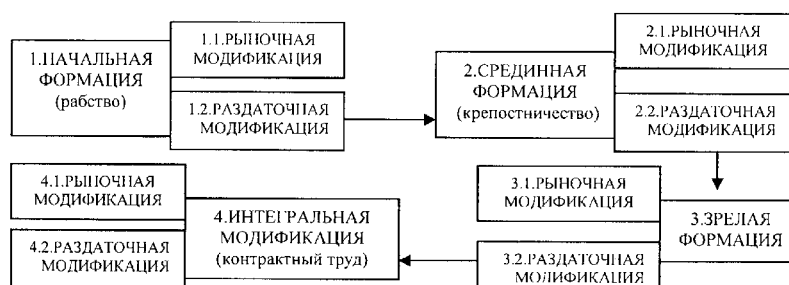
Рис. 2. Процесс общественного развития по О.Э. Бессоновой [15]

Таким образом, О.Э. Бессонова наиболее полно раскрывает идею о параллельном развитии рыночных и раздаточных модификаций, причем выделяет в истории помимо рыночного и раздаточного рабства также оба вида крепостничества и системы наемного труда.