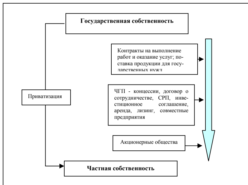
Рис.1 Взаимодействие государственного и частного секторов

дачу государством частному капиталу прав собственности, поэтому приватизацию нельзя считать формой ЧГП (см.рис.1).