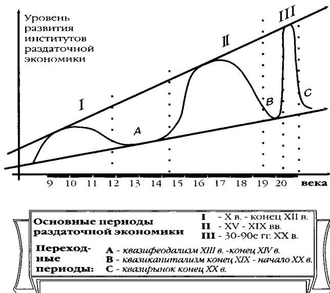
Рис. 1. Институциональные циклы в развитии раздаточной экономики России

Эволюция раздаточной системы в России прошла уже три крупных цикла (рис. 1):