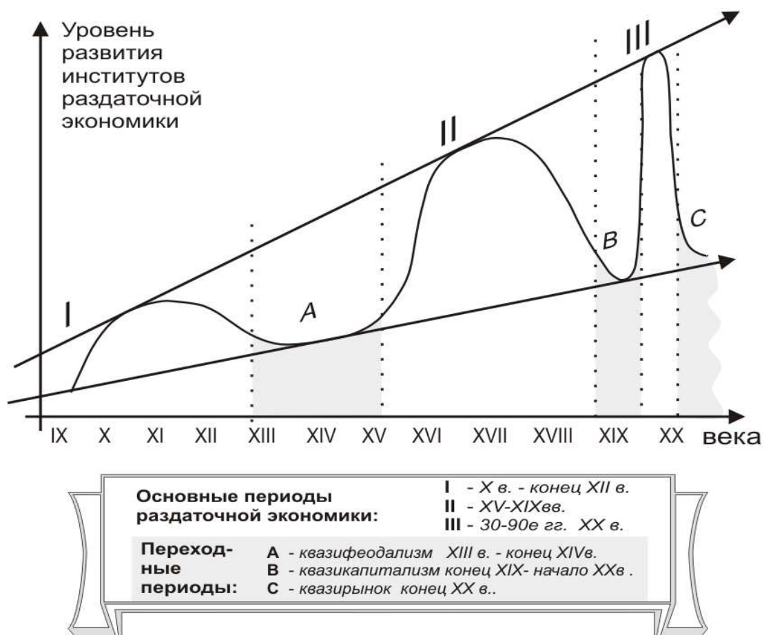
Рис.2. Институциональные циклы в развитии раздаточной экономики России

На каждом цикле существует своя форма воплощения институтов раздаточной экономики, которая преобразуется в новые, более развитые, формы в следующем цикле. Три институциональных цикла представляют собой три последовательные стадии хозяйственного развития России.